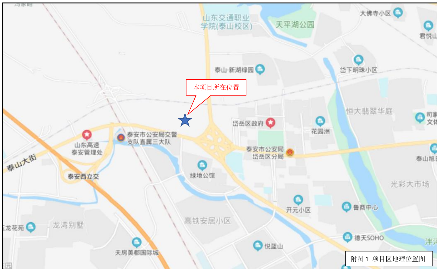
附图 1 项目区地理位置图